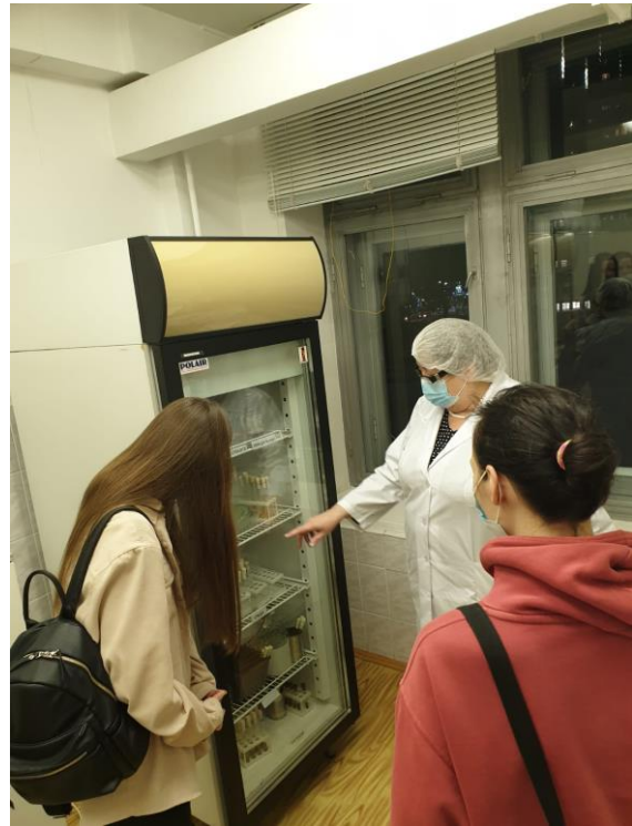
Кафедра микробиологии и вирусологии