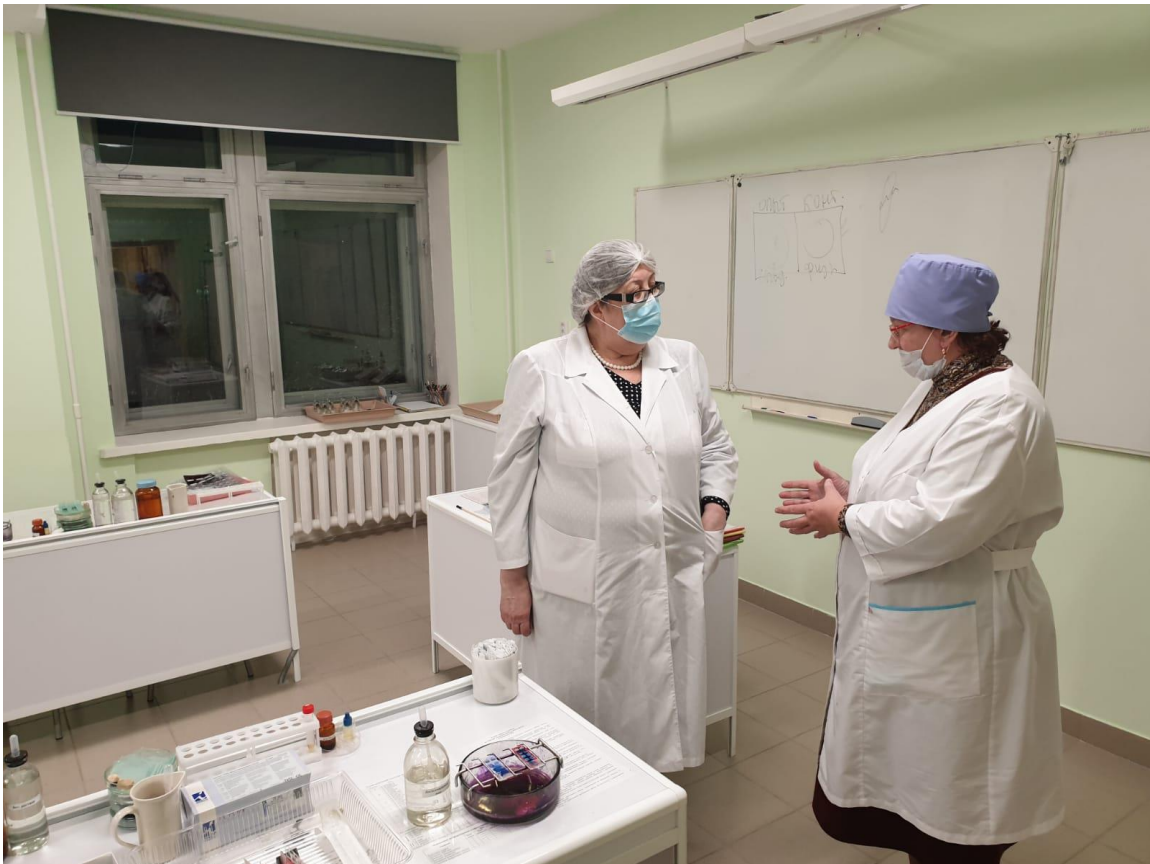
Кафедра микробиологии и вирусологии